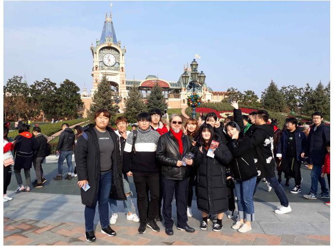
(왼쪽 사진 - 와이탄 야경 탐방/ 오른쪽 사진 - 디즈니랜드)