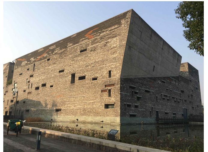
(왼쪽 사진 - 예원+예원 옛거리 답사/ 오른쪽 사진 - Ningbo History Museum)

2017년 12월 25일~28일 건축과 학우 3학년 김소현(인명여고 출신), 2학년 한상명(경기 검정고시 출신), 노지예(학익여고 출신), 손소연(인천 고잔고 출신), 김다혜(인일여고 출신), 1학년 조용훈(안산 공업고 출신) 중국 상해 닝보 항주 건축 답사를 다녀왔다. 젠다이희말라야센터 견학을 시작으로 푸동금융중심 답사와, 닝보와 항주에 있는 건축가 왕슈의 건축 작품들을 답사하였으며, 디즈니랜드, 와이탄 야경 탐방 등 3박 4일 동안 짧다면 짧고 길다면 긴 의미 있는 답사를 마쳤다. 여러 장소를 들리면서 중국의 유명 건축 답사를 할 수 있는 귀한 시간이었고, 학보사를 통한 건축과 학우들의 협동심을 키울 수 있었다. 무사히 안전하게 귀국해준 학우들과 (학보사 주간교수)최준오교수님께 수고의 박수를 보낸다.