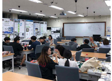
▲ 위 사진은 건설ERP관리사 1급 (직업능력개발원 민간자격증) 취득한 16명 학생들입니다.

지난 6월 11일 국제교육관 4층 413호에서 건설ERP관리사 5주차 특강이 있었다.