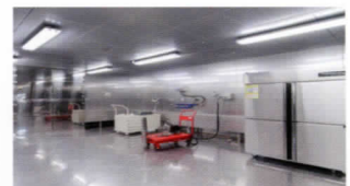
| 대기전력 |

(주) 씨티아이인증원은 늘 고객과 함께하고 더불어 성장하는 기업이 되겠습니다.