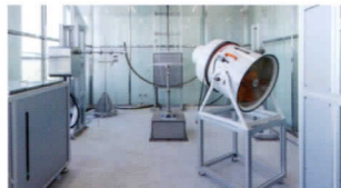
| IP 시험 (saline) |