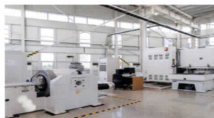
| 포장운송시험 |