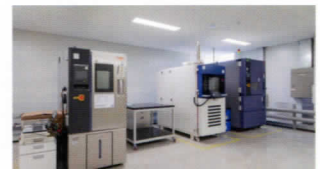
| 열충격시험 |