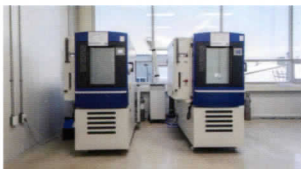
| 가스부식시험 |