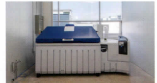
| 복하부식시험 |