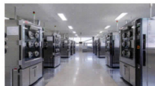
| 자동차부품 신뢰성시험 |