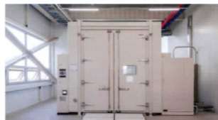
| 대형항온, 항습시험 |