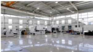
| 진동시험 |