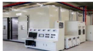
| 에너지효율시험 |