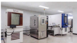
| 항온항습시험 |