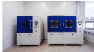
| IP 시험 (분진) |